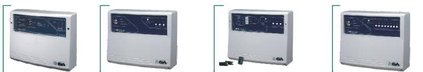
PROTEC3 Centrale antifurto 2 zone + 24h PROTEC4 Centrale antifurto 3 zone + 24h PROTEC5X Centrale antifurto 3 zone + 24h IMQ con chiave elettronica PROTEC9 Centrale antifurto 8 zone + 24h